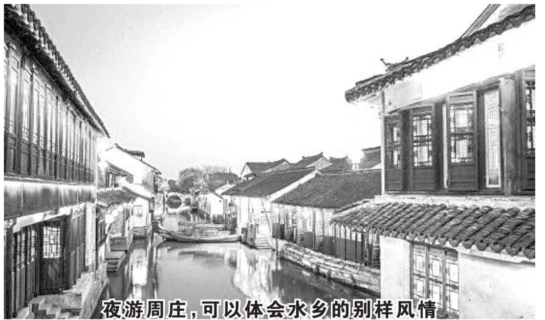
夜游周庄，可以体会水乡的别样风情。

南湖怀抱中的周庄因水而美丽，也因水而避开了历代的战乱纷扰。镇上大多数的民居都是明清时期的古建筑，至今仍然完整的保留着当年的风格和结构。周庄不光拥有流水、石桥、古居，还有着丰富的文化底蕴。中国历史上著名的文学家张翰、诗人刘禹锡等都曾在周庄居住过；而元末明初的江南巨富沈万三在周游全国之后，更是选择长居周庄，将周庄作为他的根基之地。